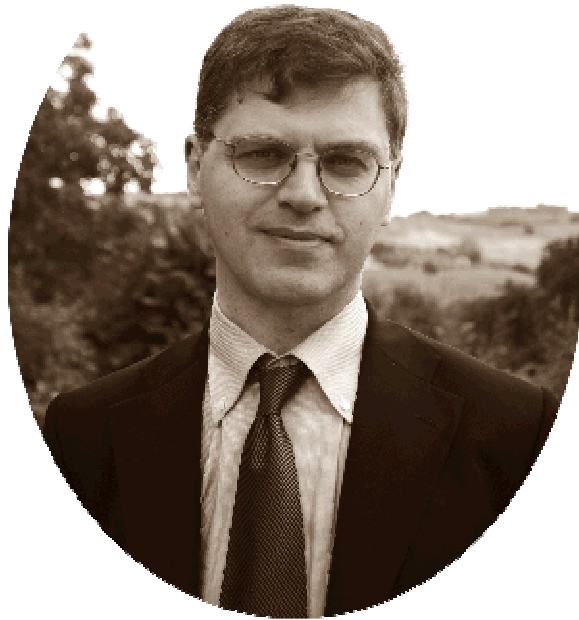
Giovanni Ruggeri (1962)