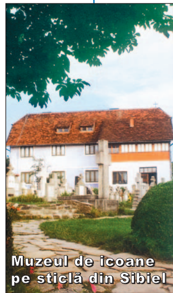
Muzeul de icoane pe sticlă din Sibiel