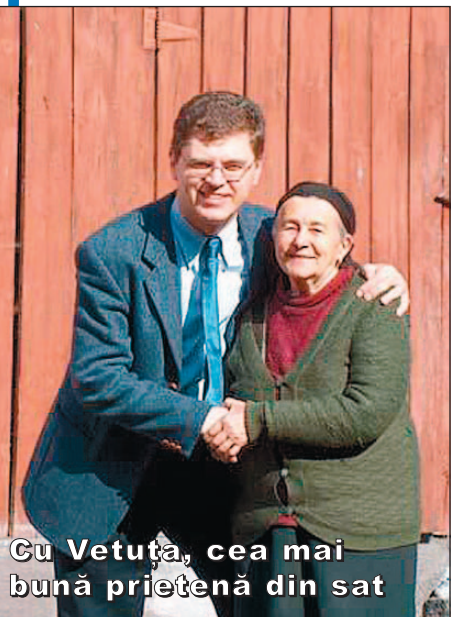
Cu Vetuța, cea mai bună prietenă din sat